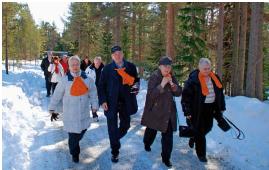
Deltagarna under leaderträffen den 1-2 april i Lövånger fick chans att besöka Bjuröklubbs fyr.