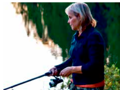
Fritidsfiske och fisketurism