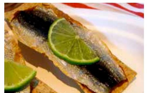
Nu tar man tillvara på HELA siklöjan.