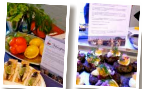
Siklöja i olika former.