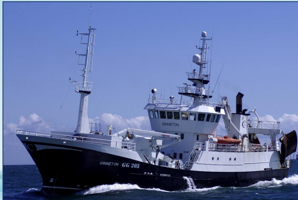
ANTON PAULRUD, SPF PO

11 NOVEMBER 2019, ÖSTERSJÖN 2020 SIMRISHAMN